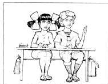
ВЫПОЛНЯТЬ ЗАДАНИЯ УЧИТЕЛЯ