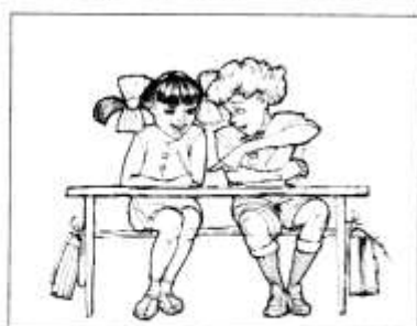
ДРУЖИТЬ С РЕБЯТАМИ

Рисование на тему «Я - дошкольник, я - школьник».