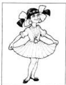
ПОХВАСТАТЬСЯ НОВОЙ ОДЕЖДОЙ