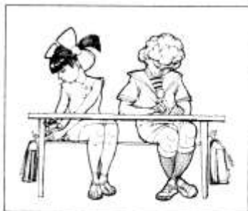
ИГРАТЬ НА УРОКЕ